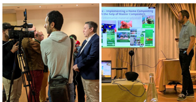
Studiebezoek Castilla La Mancha / Ciudad Real (RSUSA, Spanje)

De eerste 'Study visit' (incl. thematisch seminarie en eigenlijke opstart van het samenwerkingsproject) vond plaats in Ciudad Real en omgeving, in het zuiden van Spanje.