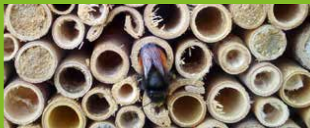
Eén bij legt max. 20 nestcellen aan